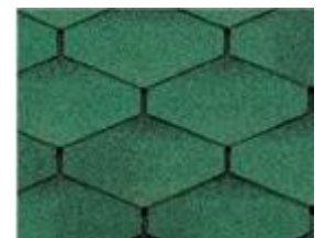
BTM Shingle Petek Vert