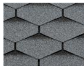
BTM Shingle Petek Gris