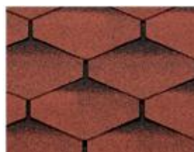
BTM Shingle Petek Rouge